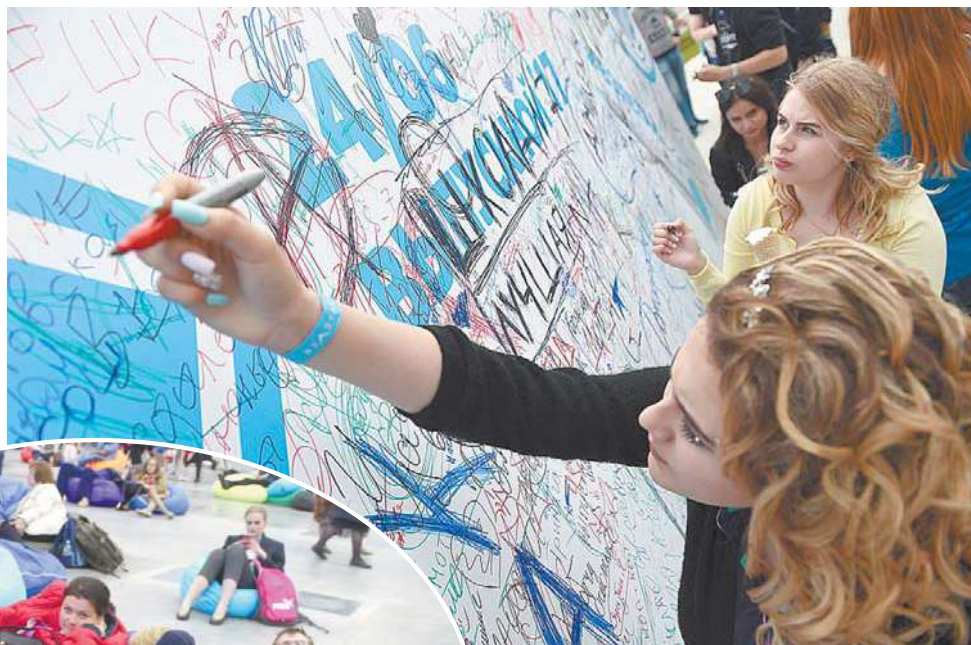
Автограф на стене выпускников

21.00. Дискотека! Всё было организовано безупречно: танцпол, еда, места отдыха... Всего и всем хватало. Учителя, родители, директора школ и прочие сопровождающие смо-