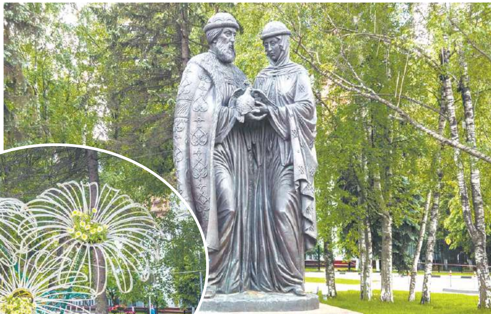
Символ любви и верности

Что касается более близких к нам событий истории, память о них тоже хранят в Химках. В районе 23-го километра Ленинградского шоссе находится мемориал «Противотанковые ежи»: вдоль магистрали виднеются три стальные шестиметровые фигуры. Части оборонительных