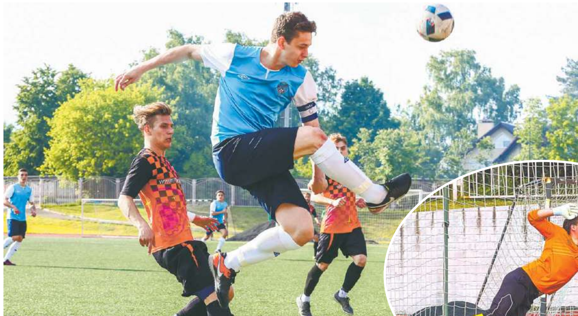
Ради гола приходилось прыгать выше головы