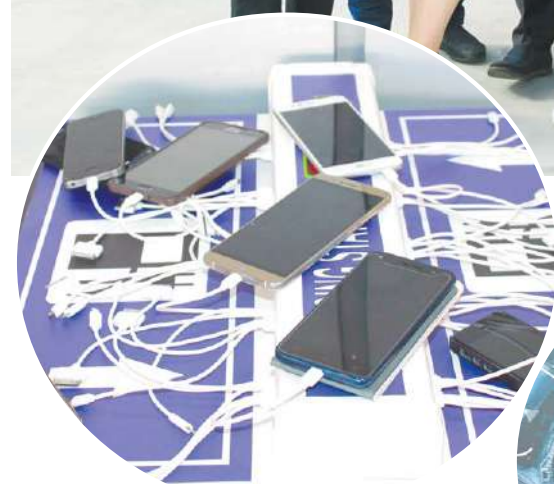
Зарядить, чтобы не упустить самых ярких моментов!