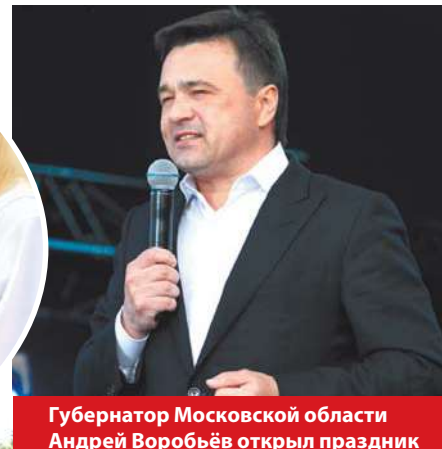
Губернатор Московской области Андрей Воробьев открыл праздник