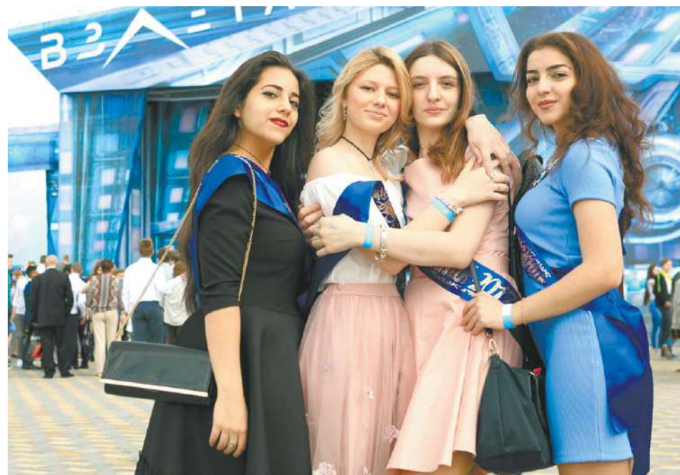
Красавицы и умницы наукограда

сторон и огромная территория парка в распоряжении: можно было осмотреть военную технику, поваляться на креслах-мешках, познакомиться и потусить. И вообще найти развлечение на свой вкус. Группа