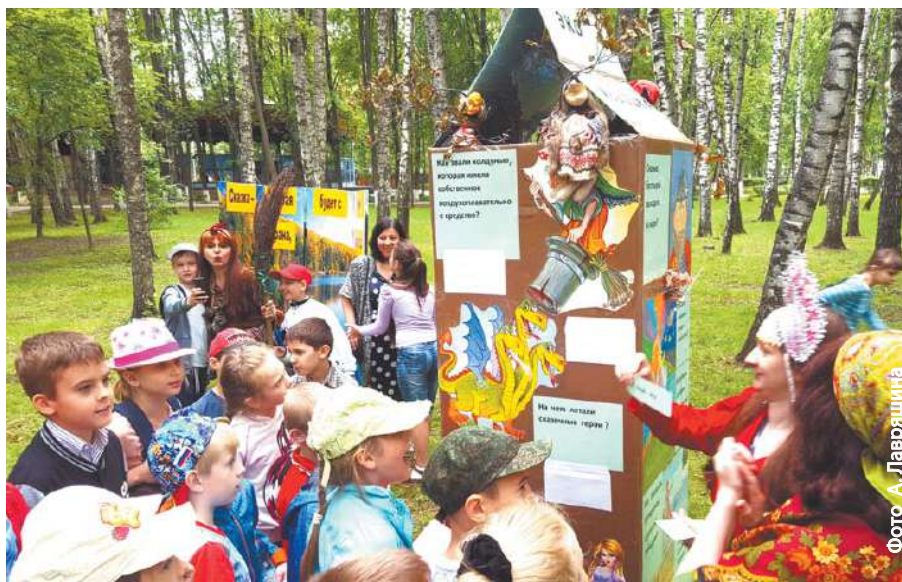
Вопросы Кота Учёного не застали детей врасплох