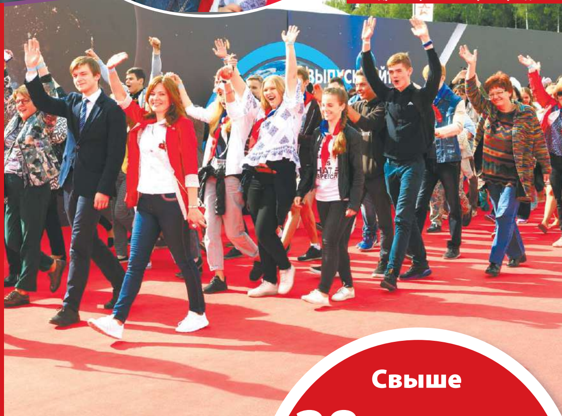
На красной дорожке – делегация Королёва

ПЕРВЫЙ ПОДМОСКОВНЫЙ ВЫПУСКНОЙ ДЛЯ ВСЕХ ШКОЛЬНИКОВ РЕГИОНА УДАЛСЯ! ТАКОЙ ВЫВОД МОЖНО СДЕЛАТЬ ПО ВЫЛОЖЕННЫМ В СОЦСЕТЯХ ВИДЕО И ФОТО ЕГО УЧАСТНИКОВ. А ПРОШЁЛ ПРАЗДНИК НА ТЕРРИТОРИИ ВОЕННО- ПАТРИОТИЧЕСКОГО ПАРКА КУЛЬТУРЫ «ПАТРИОТ» В ОДИНЦОВСКОМ РАЙОНЕ.