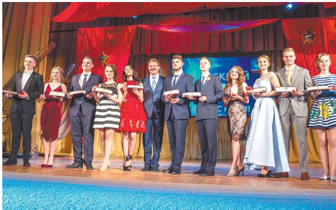
На сцену пригласили лучших выпускников-2017

«ВЗЛЕТАЙ С НАМИ!» – ПОД ТАКИМ ДЕВИЗОМ В БОЛЬШОМ ЗАЛЕ ЦДК им. КАЛИНИНА 23 ИЮНЯ, ЗА ДЕНЬ ДО ОБЛАСТНОГО ПРАЗДНИКА, ПРОШЁЛ ВЫПУСКНОЙ БАЛ 2017 ГОДА, НА КОТОРЫЙ ПРИГЛАСИЛИ ВЧЕРАШНИХ ШКОЛЬНИКОВ, ВСТУПАЮЩИХ ВО ВЗРОСЛУЮ ЖИЗНЬ.