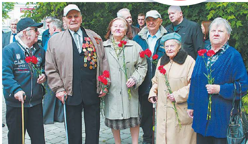
На митинг пришли ветераны КТРВ

отданы за неё, поклониться живущим в городе фронтовикам.